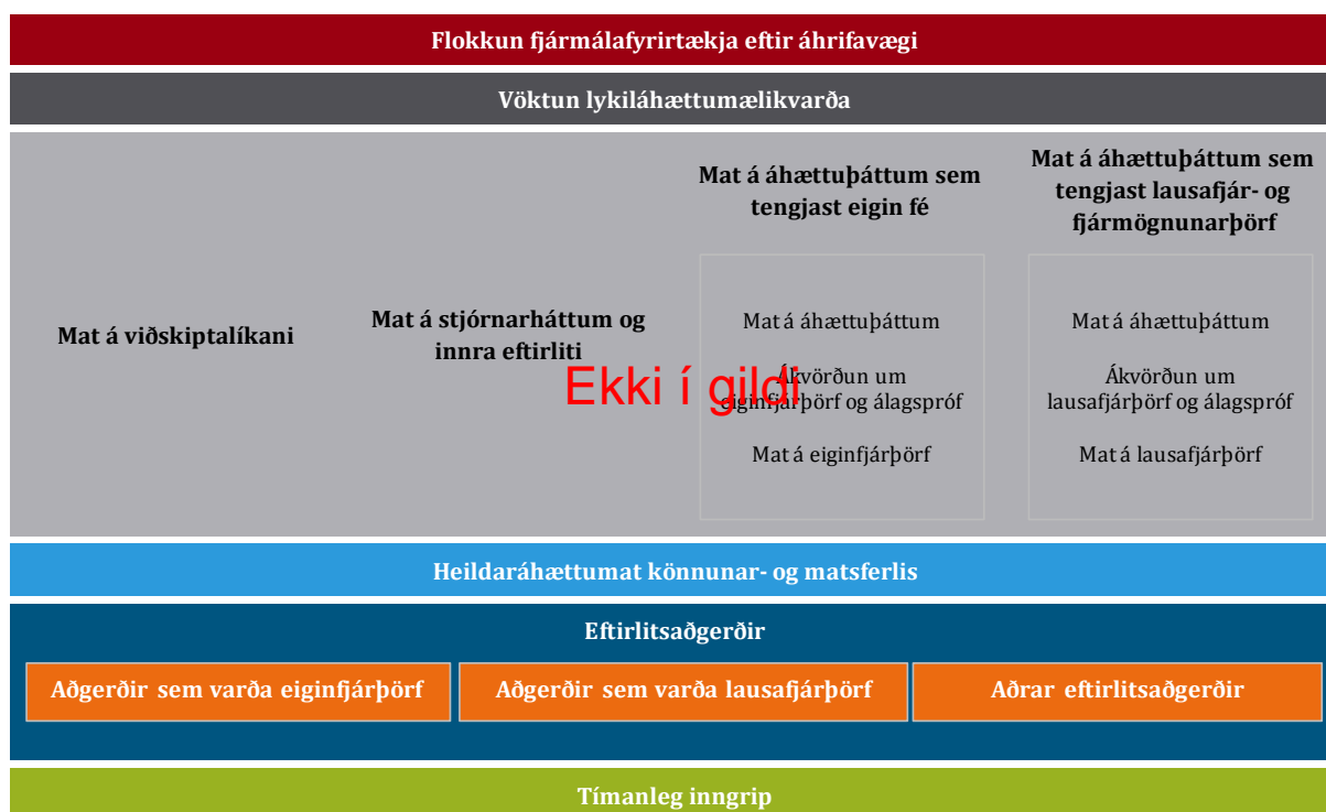
Mynd 1: Umgjörð könnunar- og matsferlisins (e. SREP framework)

Könnunar- og matsferli Fjármálaeftirlitsins má skipta upp í nokkra meginþætti, eins og lýst er á mynd 1. Nánar er greint frá einstökum þáttum í köflum 2.2.-2.6.